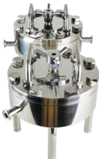
Extrudeur en ligne