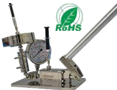
Homogénéisateur avec extrudeur