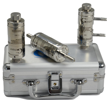
均質化キャビティ